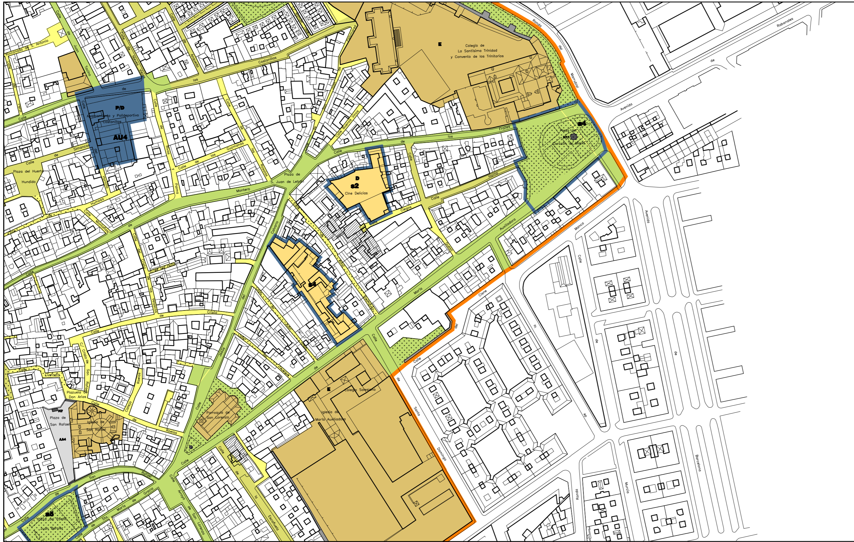
SITUACION PEPCH ESCALA 1:2.000